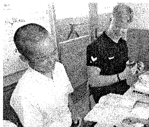
地図やiPadでコミュニケーションをとりました